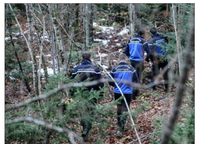
Un jeune chasseur de 20 ans, soupçonné d'être l'auteur du tir mortel, avait été placé en garde à vue et mis en examen pour "homicide involontaire".